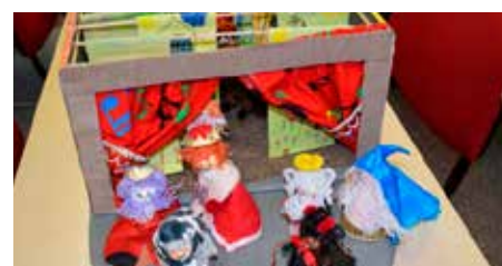
1. místo v kategorii společných děl Družina Skorošice